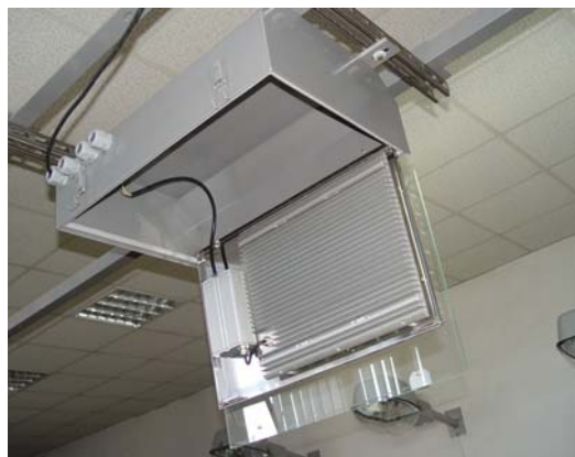
PowerLED - Tunnelleuchte für Durchfahrt in Ausführung W.Nr. 1.4571/1,25mm